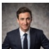
Félix de Belloy