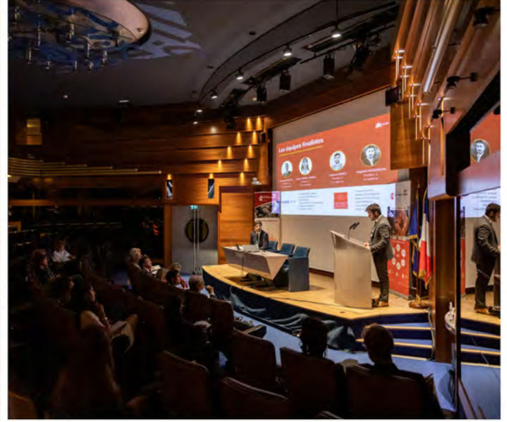
@ICGRC Edition 2023, Grande Finale, Maison du Barreau de Paris