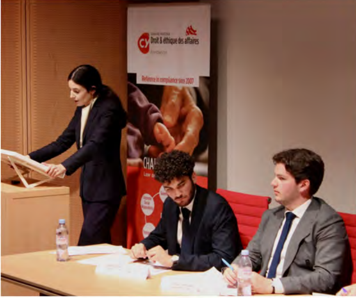
@ICGRC Edition 2022, Grande Finale, Maison des Avocats